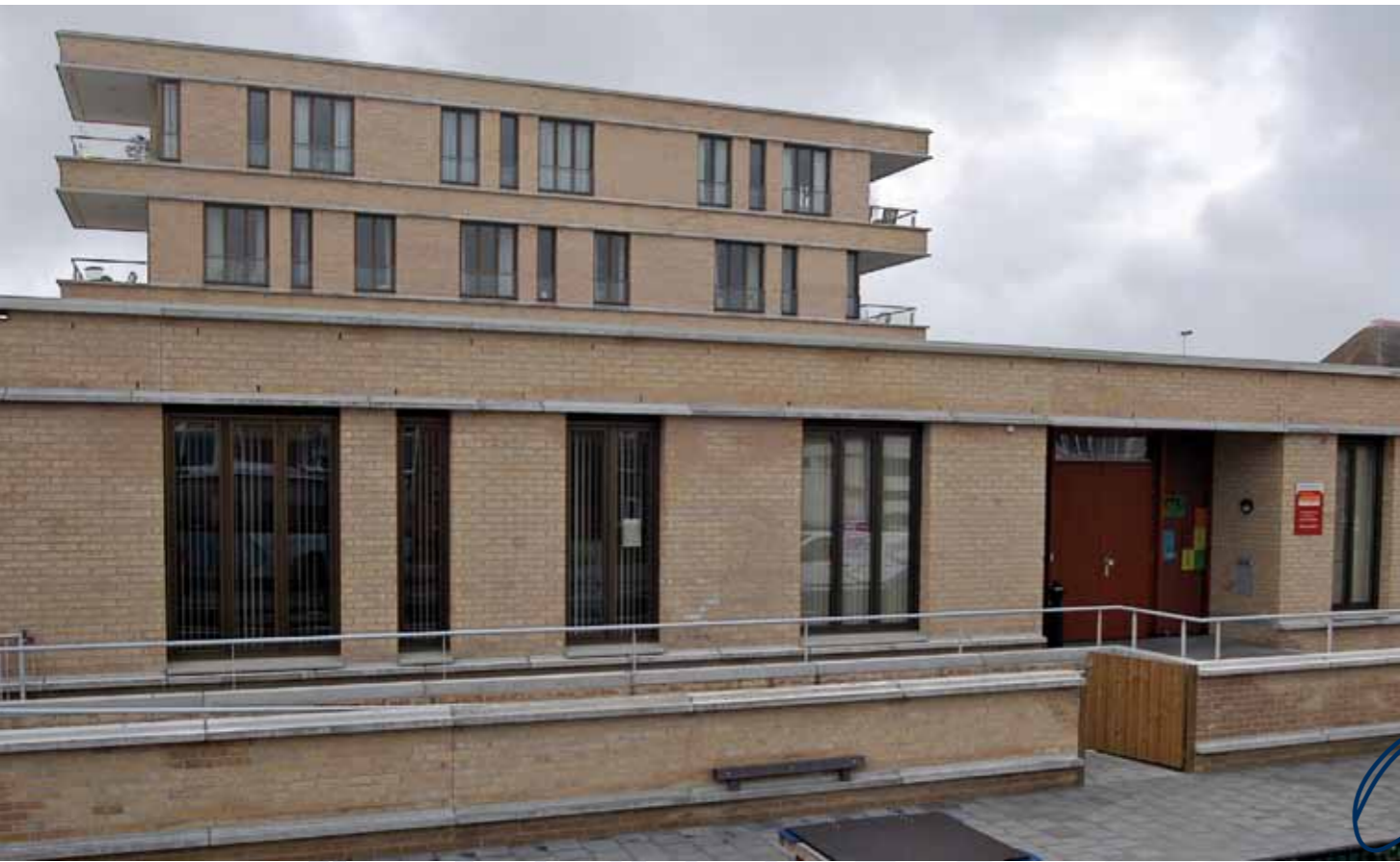
Het nieuwe onderkomen van SJWB. Hiernaast is ook peuterspeelzaal Pinokkio gevestigd.

Jeugd- en jongerenwerk zit goed in nieuw onderkomen