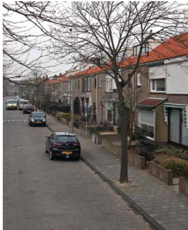
Dr. Hadriaan van Neslaan

C.L.C.W. Pické (1834-1885) was burgemeester van Noordwijk van 1866 tot zijn dood in 1885. Hij werd slechts vijftig jaar oud, maar tijdens zijn 19-jarige ambtsperiode heeft hij de grondslag gelegd voor Noordwijk als gerenommeerde badplaats. Pické zag het als zijn levensideaal om in Noordwijk een badhotel en een stoomtramlijn te realiseren. Voor dat eerste doel begon hij met de exploitatie van het duingebied ten zuiden van het vissersdorp. Tijdens zijn leven werd een begin gemaakt met het creëren van de infrastructuur voor de villa's en hotels in het gebied dat nu bekend staat als 'de Zuid'. In 1883 stak Pické persoonlijk de eerste schop in de grond voor de bouw van het eerste badhotel. Kort voor zijn dood in 1885 zag hij zijn tweede wens vervuld: de eerste stoomtram reed het dorp binnen. De Noordwijkers begroetten de nieuwe tram met gejuich. Dankzij deze nieuwe faciliteiten mocht Noordwijk niet lang daarna wereldberoemde persoonlijkheden begroeten als de danseres Isadora Duncan en de grondlegger van de psychoanalyse, Sigmund Freud.