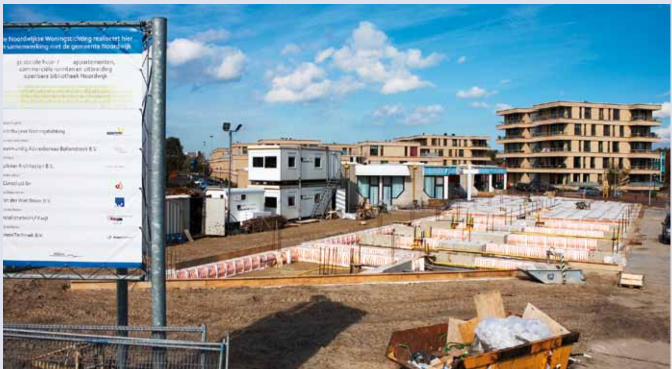
Bouw Morgenster