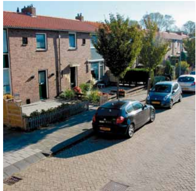
De la Bassecour Caanstraat

zag halverwege de 19e eeuw de eerste badgasten naar Noordwijk komen. In heel Europa trokken schrijvers, dichters, kunstenaars en leden van de 'hogere kringen' naar de kust vanwege de heilzame werking die aan zeelucht en -water werd toegeschreven. Van Konijnenburg zag mogelijkheden dit uit te baten en liet in 1857 vier badkoetsen uit Scheveningen overkomen. De koetsjes met de baders werden door paarden een stuk in zee getrokken. Via een trapje aan de achterkant, ontrokken aan het oog van de dorpelings die het ritueel met verbazing en grote hilariteit bekeken, stapten ze naakt in de golven om de krachten van het water op hun hele lichaam te laten inwerken. Toen bleek dat de badgasten ook wilden blijven overnachten begon Van Konijnenburg een nieuw soort logement, een 'badhotel'. Op de plaats waar sinds de 17e eeuw de dorpskerk 'de Vergulde Waegen' had gestaan en waar later het beroemde Palace Hotel zou verrijzen, opende hij in 1866 zijn 'Badhotel Konijnenburg'. De geschiedenis van Noordwijk aan Zee als badplaats was daarmee begonnen. Eén van Van Konijnenburgs nakomelingen is de schrijfster Susan Smit. In haar laatste roman 'Vloed' vertelt zij niet alleen het liefdesverhaal van Van Konijnenburgs dochter Adriana, maar laat zij het Noordwijk van rond 1900 beeldend tot leven komen. De reden waarom Willem Hendrik in de wijk Duinpark twee aangrenzende straten naar zich vernoemd heeft gekregen, wordt in dit boek echter ook niet onthuld.